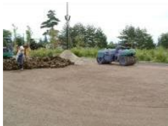
碎石路盤上にグラスミックスを150mm厚で敷均し後、重機で転圧。