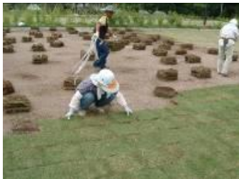
締め固め度 95%以上(最大乾燥密度に対する、現場で測定した乾燥密度の割合)で転圧をしたグラスミックス基盤に、直接芝生を植栽。