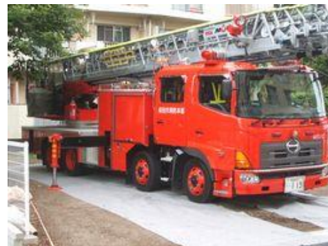
写真1 消防車乗り入れ試験(グラスミックス敷き均し後)

本工法における植栽基盤材(人工基盤土壌)が《グラスミックス》であり、芝生舗装の基盤材として土壌物性および土壌養分性ともに優れた資材となっております。