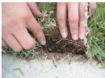
施工後3ヶ月の状況。すでにランナーが出ていて、生育は良好。