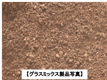
【グラスミックス製品写真】