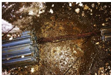
← 掘削時の様子 円形配管ユニットのうち、一つに根詰まりが起きている。

ネドメトレンチの外周部に根は集中するものの、内側の配管への侵入はありませんでした。