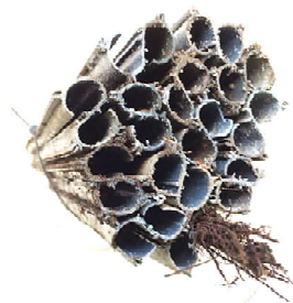
← 断面写真 他のユニットへの根の侵入は見られない。