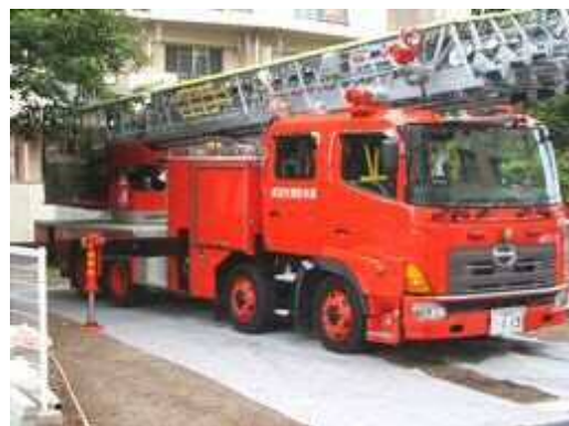
写真1 消防車乗り入れ試験(グラスミックス敷き均し後)

このようなケースは舗装面などを作る土木工事(固める)と、緑地面を作る緑化工事(緩める)の求める機能が相反するために発生します。土木的基盤条件の中で緑化土壌条件の質と量をいかに両立させ、良好に保つかが豊かな緑創りのポイントとなります。