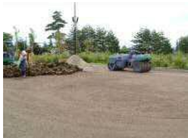
排水層上にグラスミックスを150mm厚で敷均し後、重機で転圧。