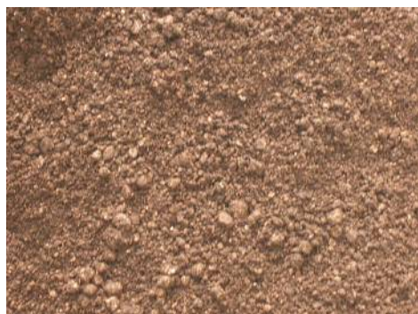
【グラスミックス製品写真】

本工法における植栽基盤材(人工基盤土壌)が《グラスミックス》であり、芝生舗装の基盤材として土壌物性および土壌養分性ともに優れた資材となっております。