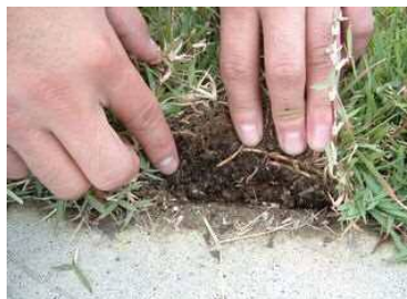
施工後3ヶ月の状況。すでにランナーが出ていて、生育は良好。