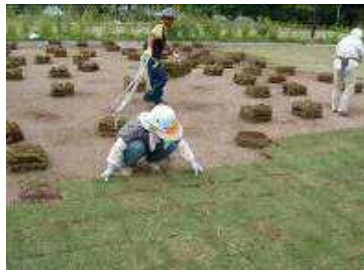
締固め度 95%以上(最大乾燥密度に対する、現場で測定した乾燥密度の割合)で転圧をしたグラスミックス基盤に、直接芝生を植栽。